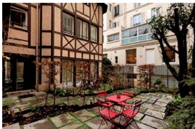
Jardin privé rue François 1 er - Paris (8 ème )

Le tableau ci-dessus est établi conformément à l'instruction AMF du 4 mai 2002 prise en application du règlement