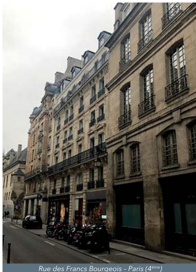
Rue des Francs Bourgeois - Paris (4 ème )

En 2018, votre Société de Gestion prévoit de lancer une nouvelle augmentation d'un montant initial de 10,0 M€ prime d'émission incluse pour une durée d'un an sur la base d'un prix d'émission de la part de 235 € (soit 6,8 % de progression par rapport au prix précédent), afin de poursuivre le développement de votre SCPI à travers des investissements en logements parisiens conforme à la stratégie.