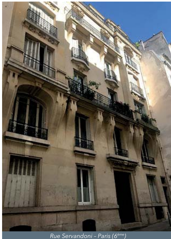
Rue Servandoni - Paris (6 ème )