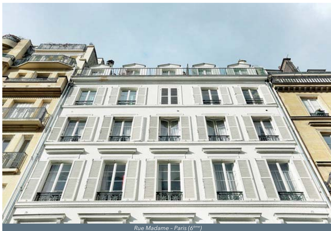
Rue Madame - Paris (6 ème )